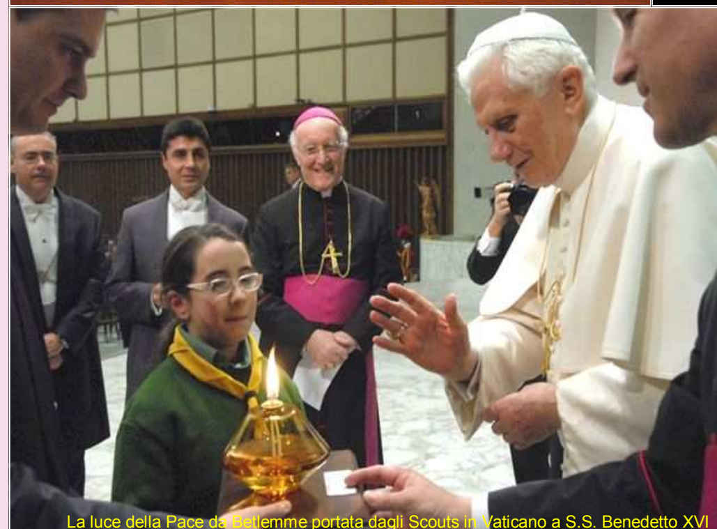
La luce della Pace da Betlemme portata dagli Scouts in Vaticano a S.S. Benedetto XVI