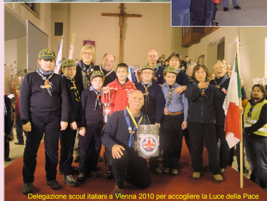
Delegazione scout italiani a Vienna 2010 per accogliere la Luce della Pace