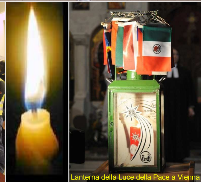
Lanterna della Luce della Pace a Vienna